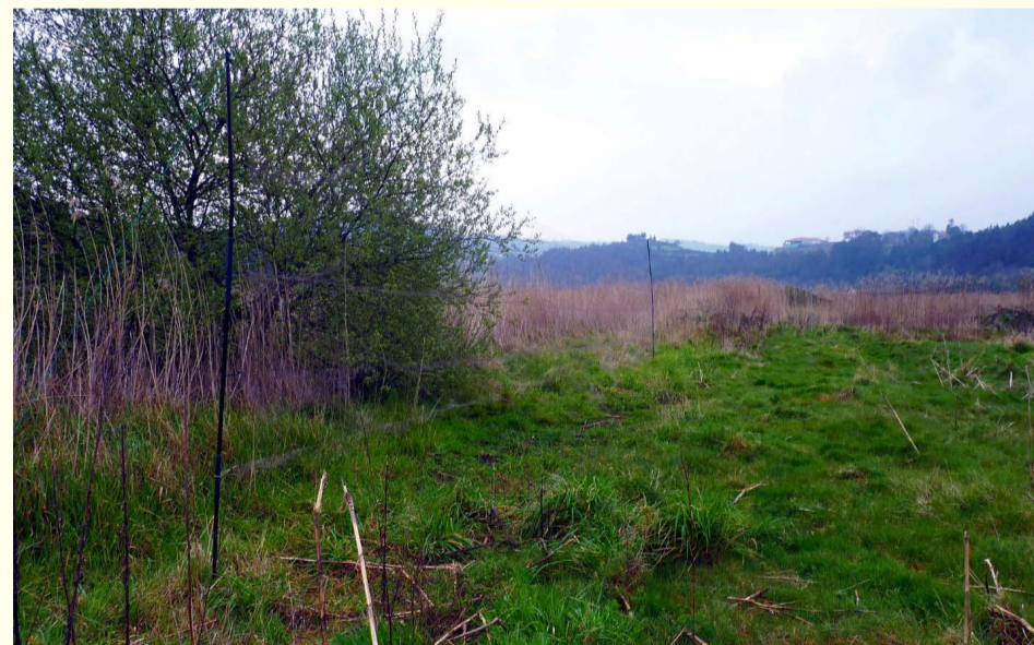
Uno de los lugares de captura

Pese a ser zona LIC y ZEPA y que el Decreto 154/2014, de 29 de diciembre, lo integra en la Zona Especial de Conservación Cabo Busto-Luanco (ZEC ES1200055) que cuenta con un Instrumento de Gestión Integrado, no hay restricciones especiales sobre el uso de productos fitosanitarios, que son usados de profusión para paliar las deficiencias de manejo agrícola.