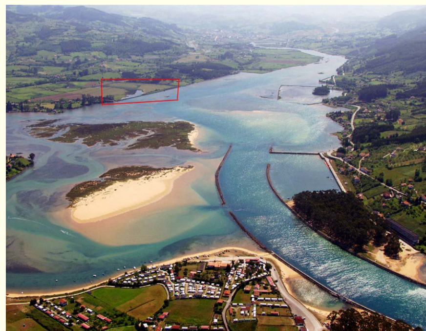
Situación de la zona de anillamiento en la Ría de Villaviciosa

El segundo lugar de estudio de la invernada de los escribanos palustres, se encuentra en el municipio de Villaviciosa (Asturias), en la Ría de Villaviciosa, a unos tres kilómetros de su desembocadura, alrededor de las coordenadas UTM 30 X:306480 - Y: 4820583.