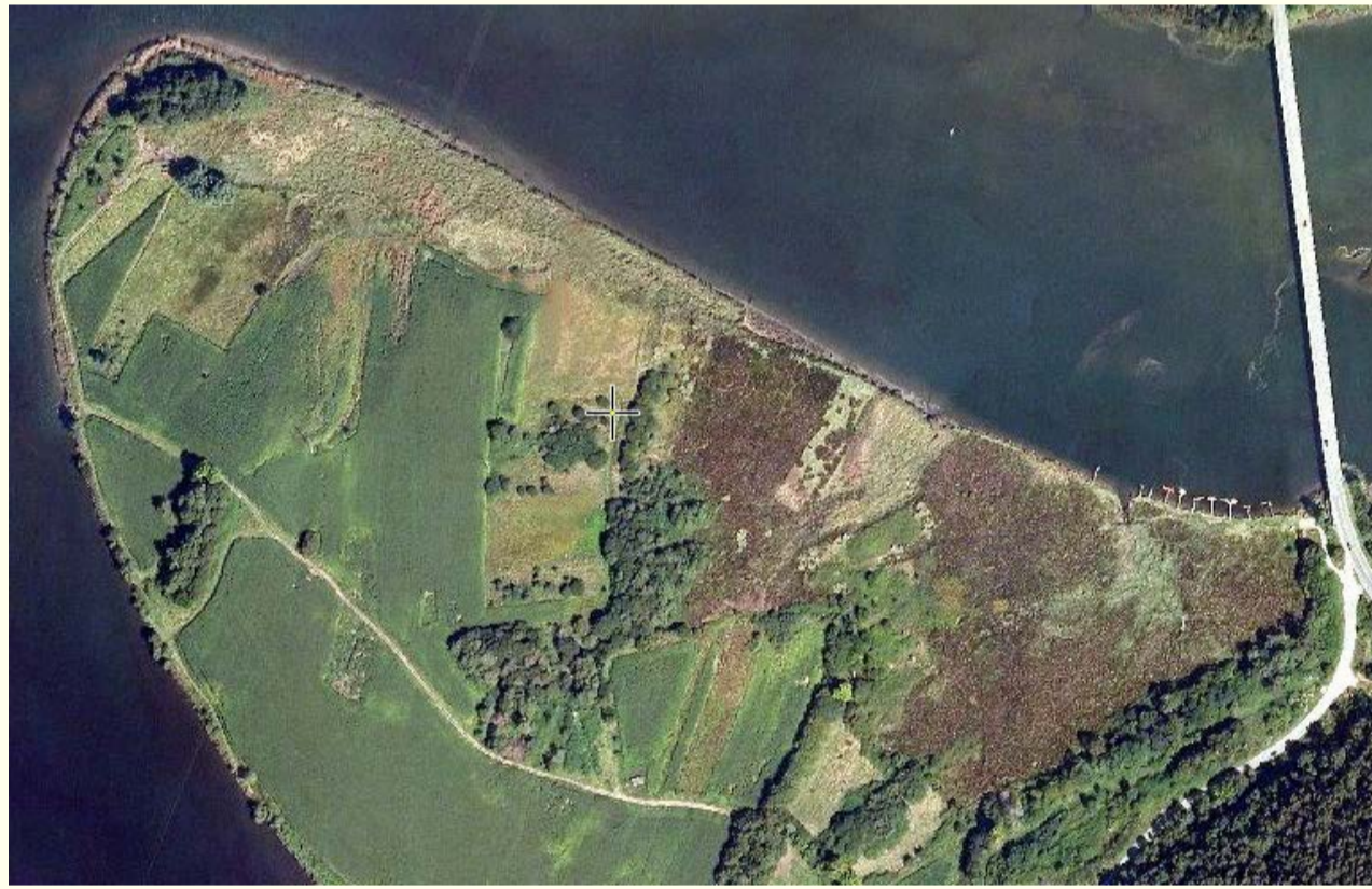
El Sablón, Meandro del Río Nalón antes del puente de la Nacional 632

El primer lugar de invernada de los escribanos palustres, donde se desarrollan los trabajos de anillamiento, se encuentra en el municipio de Soto del Barco (Asturias) en las inmediaciones de la desembocadura del Río Nalón, alrededor de las coordenadas UTM 29, X: 7354733 - Y: 4824545.